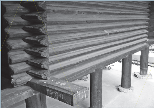
正倉院の校倉造建築

奈良の東大寺の近くの正倉院は皇室の宝物を1300年近く守り続けています。宝物にとって重要な室内環境を守っている校倉造は誰でも知っていますが、実は免震構造です。自然石が4×10の配置で整然と並べられ、上部構造が乗っているがロッキングして東揺れても元に戻るよ構造と同等以上の性能とエネルギー」であり、日本の建築梁のDNAが引き継ぎ免震構造は1980年頃