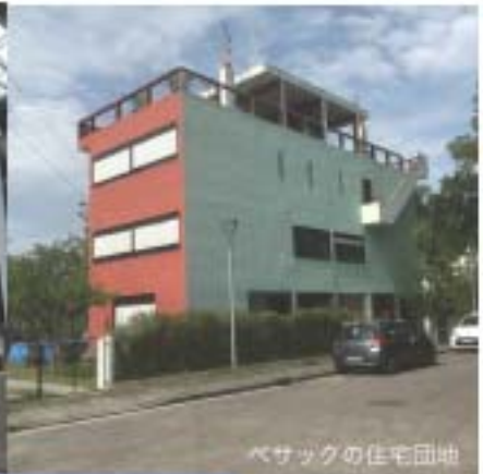
ベサックの住宅団地