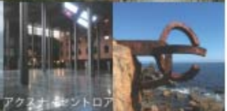
アクイスノ・サントロア