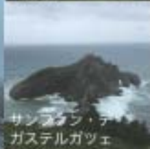
サンセバスティアン・デ ガステルガジェ