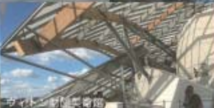
ヴィトン財団美術館