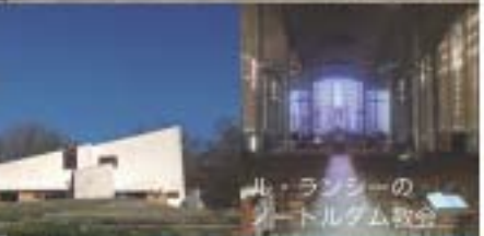
ル・ランシーの ノートルダム教会