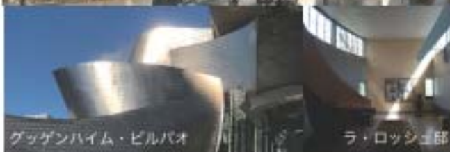
グッゲンハイム・ビルバオ