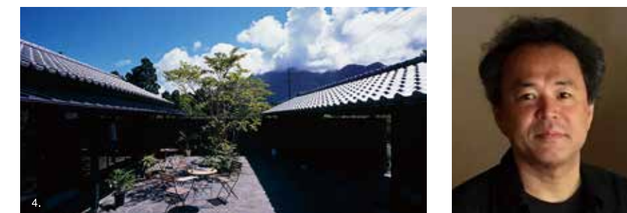
1.2.屋久島の家II 3.ガンツウ 4.屋久島メッセンジャー