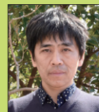
西沢立衛 © Office of Ryue Nishizawa