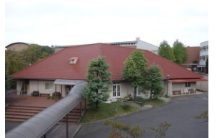
撮影: 笠原一人氏 (右列)